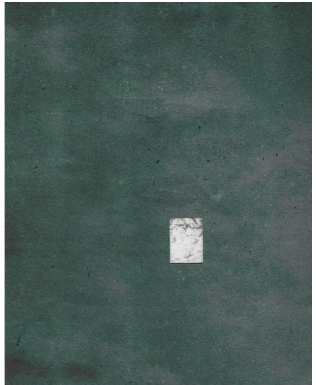
"vert" Serie, je 30x24 cm, 2016